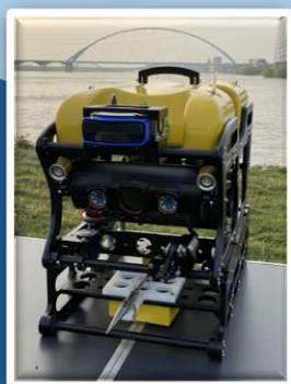
Seamor Marine社製 水中ロボット